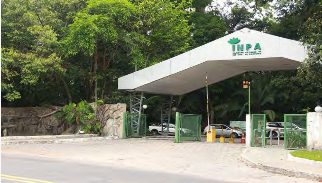
Sede do Inpa em Manaus

Além da falta do dinheiro do Instituto em si, os projetos de pesquisa de fontes como o CNPq e o governo estadual há muito tempo não vêm liberando parcelas já aprovadas, por falta de dinheiro nessas agências de fomento. A indicação de bolsistas também é bloqueada, pelos “Institutos Nacionais de Ciência e Tecnologia (INCTs) no CNPq, por exemplo, mesmo tendo saldos substanciais de dinheiro aprovado. Os meus próprios projetos têm sofrido muito com isto.