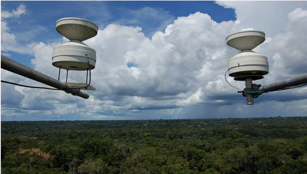
Pesquisas do Inpa na Floresta Amazônica

Brasília, e todos os institutos federais de pesquisa, inclusive o INPA, estão prestes a desaparecer se não houver uma mudança.