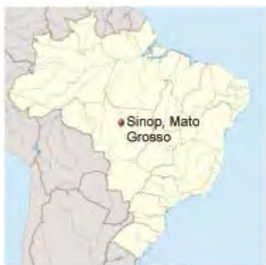
Figura 1. O reservatório da hidrelétrica de Sinop. Fonte: ([2], Vol. 1, Ilustração.1.1 SIN-V-61-612.001-DE-RO). Mapa de localização: [3].