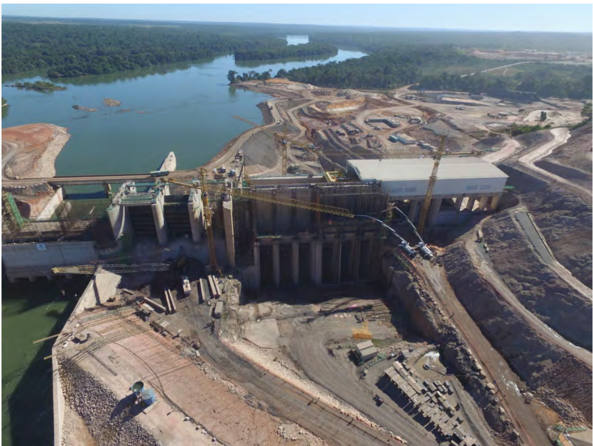
Obra da usina hidrelétrica de Sinop

A Barragem de Sinop tornou-se um caso de teste crítico – não apenas sobre a questão da limpeza de reservatórios antes do enchimento, mas também sobre o real efeito da legislação ambiental brasileira como um