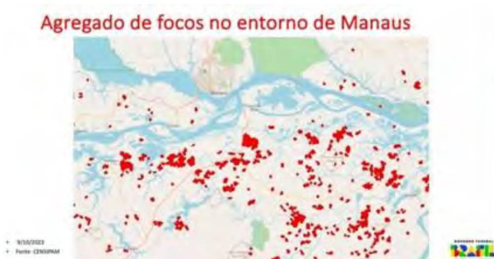
Figura 2. Locais de focos ao sul de Manaus em 2023, incluindo o Lote C [6]

A necessidade de um EIA para a reconstrução do Lote C tem sido objeto de uma longa disputa jurídica. Em 15 de dezembro de 2014, o Tribunal Regional Federal da 1ª Região (TRF1) decidiu por unanimidade que é necessária um EIA para a reconstrução do Lote C [7]. Em 28 de janeiro de 2019, o mesmo tribunal rejeitou um recurso do DNIT e reafirmou a necessidade de um EIA [8]. Simplesmente ignorando essa decisão, em 24 de junho de 2020 o DNIT lançou um edital de licitação para reconstrução de um trecho de 51,8 km dentro do Lote C, do km 198,2 ao km 250,0 [9].